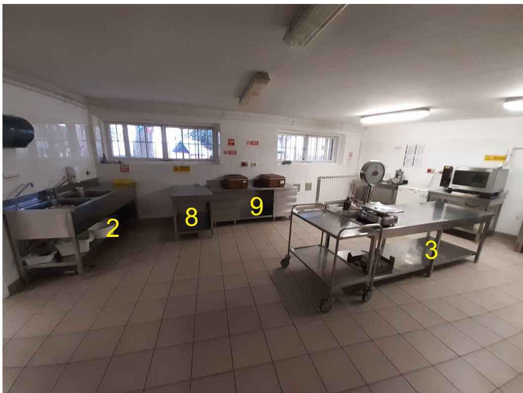
Vista cucina dall'ingresso