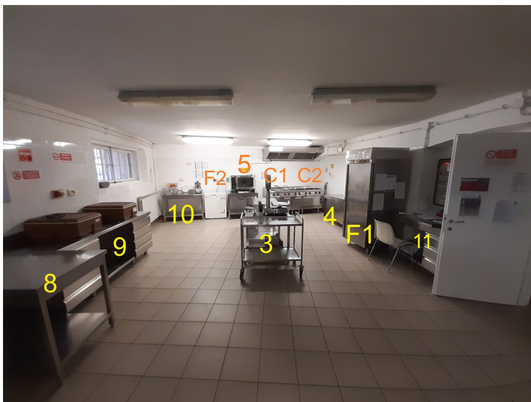
Vista cucina dalla zona lavaggio stoviglie

Di seguito alcune immagini indicative della cucina, lavanderia e dispensa esistente.