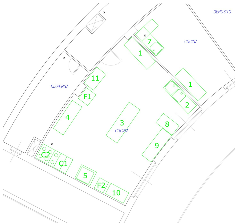
Disposizione attuale arredi della cucina

Superficie ambiente principale Cucina: 50,70 m 2