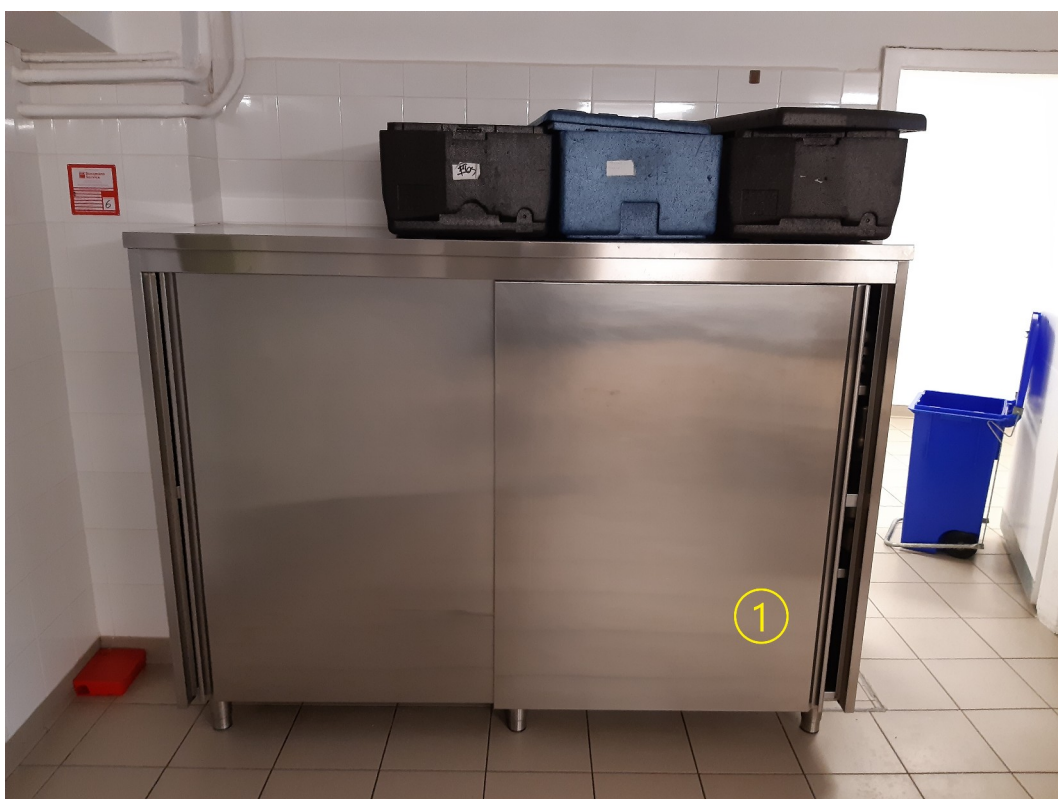
Armadio alto cucina