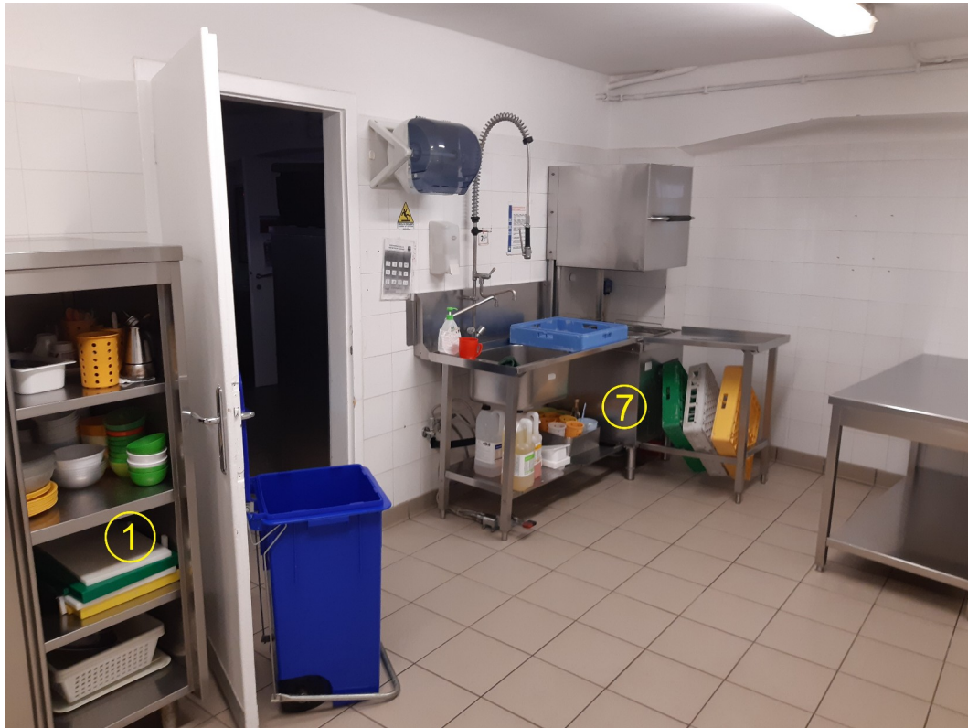
Zona Lavaggio stoviglie