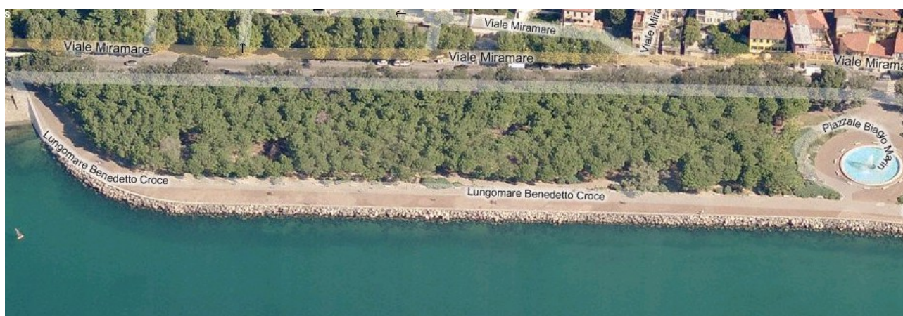
Doccia lungo la Pineta di Barcola