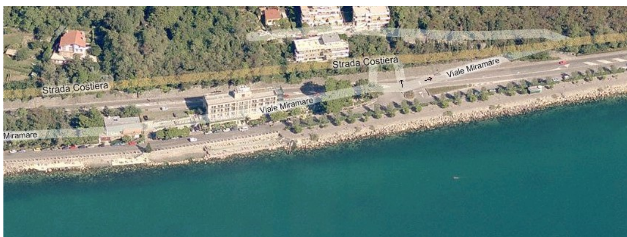
Piattaforma in località “Bivio”