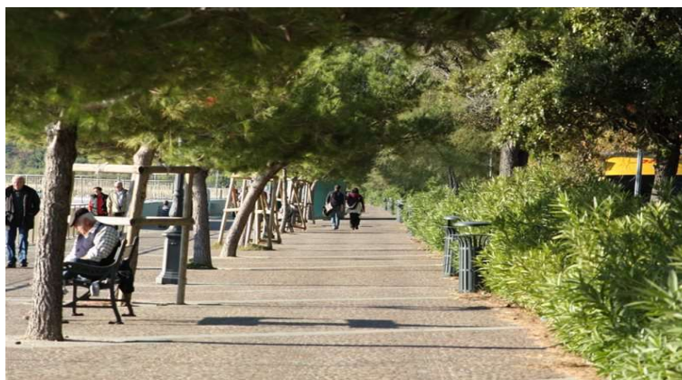
Particolare della passeggiata a mare con pino d'aleppo