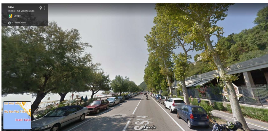
Particolare del Viale Miramare in corrispondenza dell'abitato di Barcola con platani a monte e tamerici sul lato mare

L'ambito di intervento si connota per un elevato pregio dal punto di vista ornamentale ed estetico e risulta essere uno dei luoghi di frequentazione privilegiata da una larga fascia della cittadinanza, soprattutto durante il periodo estivo. Si può quindi affermare che si tratta di uno dei più importanti ed irrinunciabili elementi del contesto cittadino, sia dal punto di vista urbanistico che storico culturale.