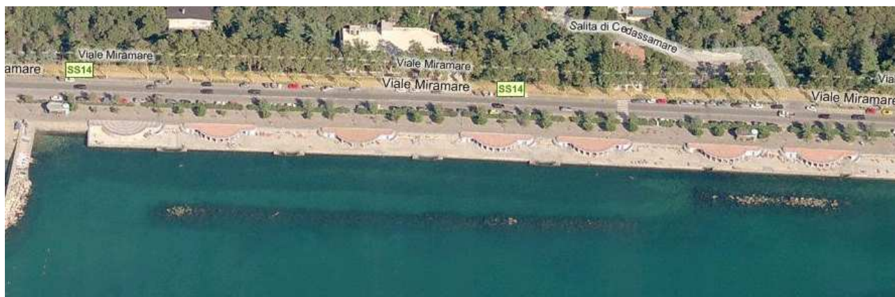
Stabilimenti balneari comunali "Topolini"

I parcheggi per l'utenza sono disposti su entrambi i lati del viale Miramare anche se non ci sono posti riservati all'utenza.