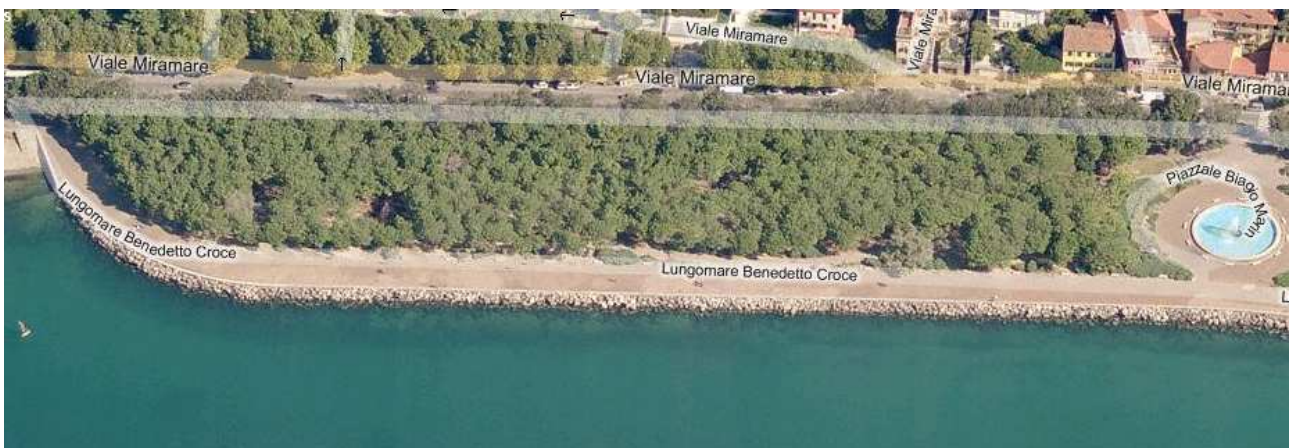
Doccia lungo la Pineta di Barcola