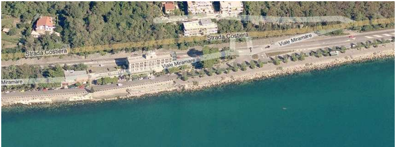
Piattaforma in località "Bivio"