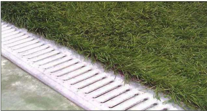
GRIGLIA IN ACCIAIO PRESSATO ZINCATO ANTITACCO A FERITOIE B125 ANTINFORTUNISTICA AD USO SPORTIVO (LARGHEZZA FERITOIA MAX.8/9MM)