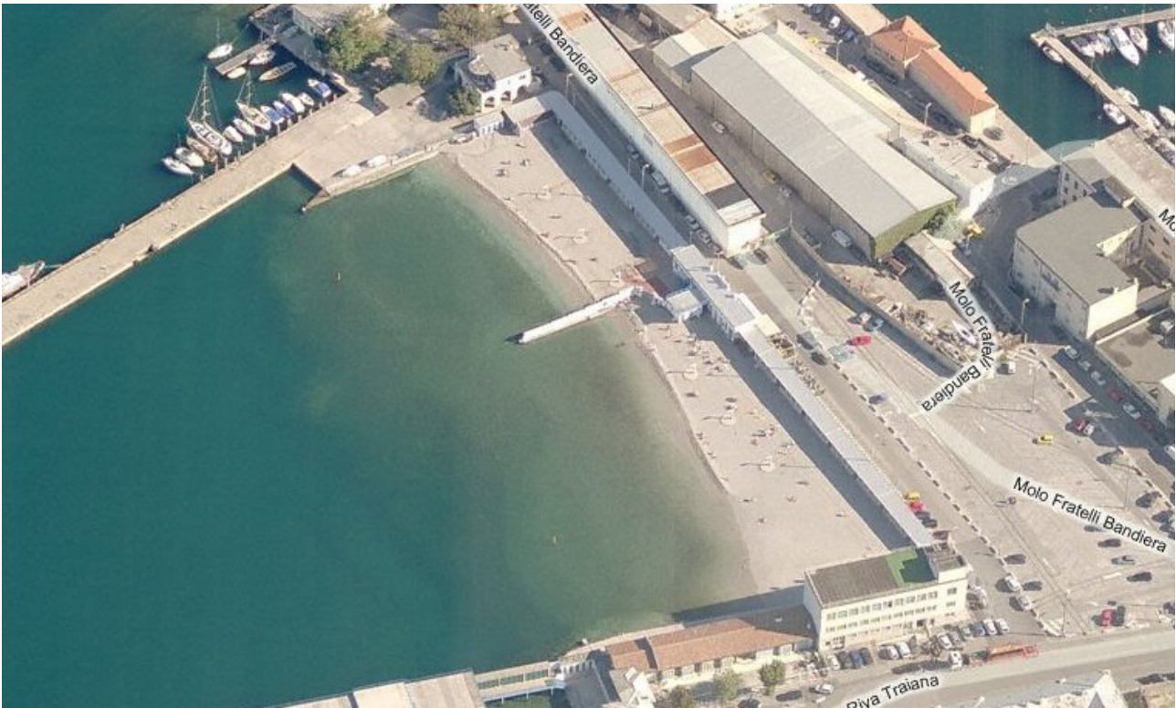
Stabilimento “Alla Lanterna”

Il fabbricato, interamente dipinto in bianco, si presenta con un piano fuori terra. L’edificio è caratterizzato dal portone d’ingresso in metallo recentemente dipinto.