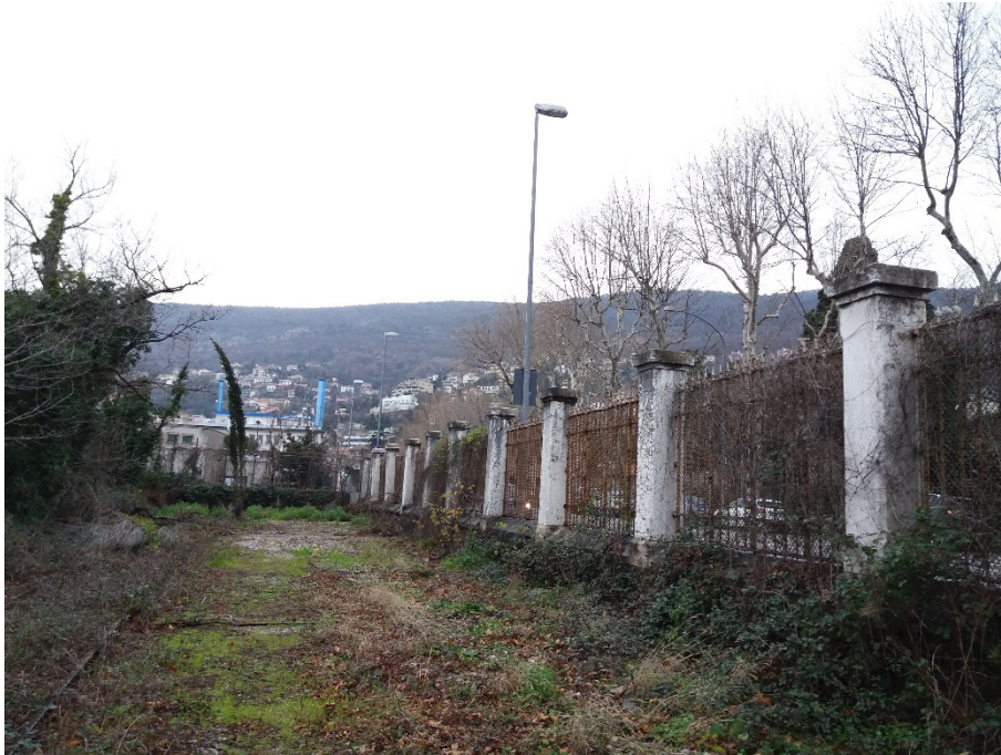
Stato attuale della recinzione storica

Intervento di restauro e manutenzione della recinzione area portuale di viale Miramare PROGETTO DEFINITIVO/ESECUTIVO - RELAZIONE DESCRITTIVA, QUADRO ECONOMICO, ELENCO DEGLI ELABORATI